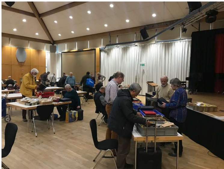
4. Großtauschtag im Oktober 2022