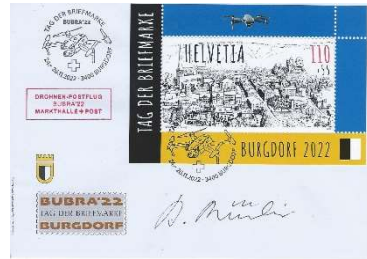
Tag der Briefmarke 2022 in Burgdorf an der Emme Beleg mit Sonderstempel zum 1. Postdrohnenflug in der Schweiz sowie Autogramm des Grafikers