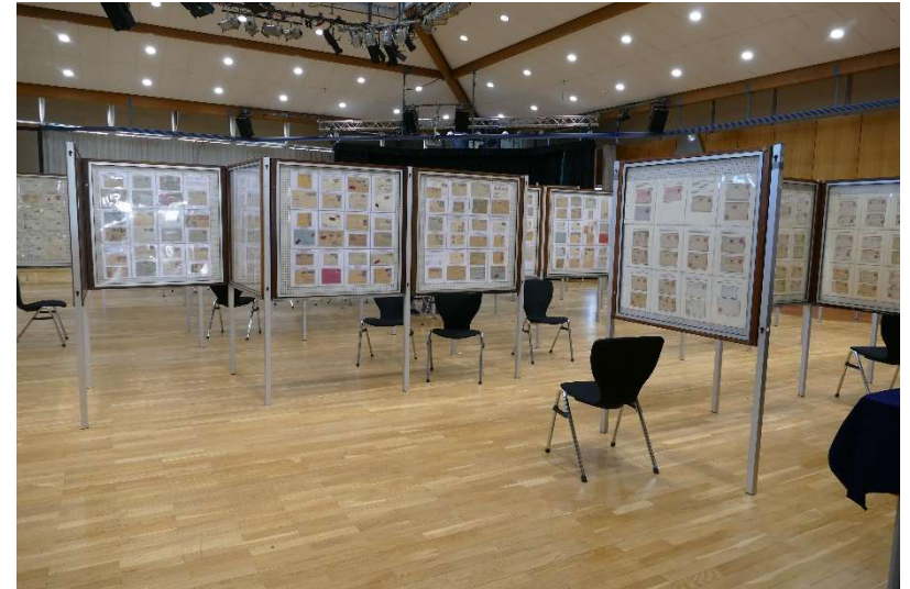
Ausstellung zum 60-jährigen Vereinsjubiläum