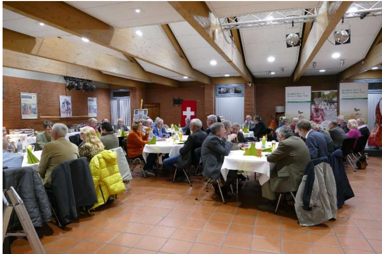
Festabend zum 60-jährigen Jubiläum des BCB