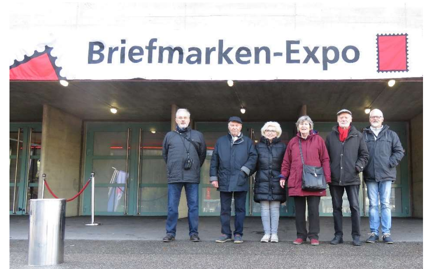
Besuch Bubra 2022 in der Schweiz anlässlich des 100-jährigen Bestehens des Vereins