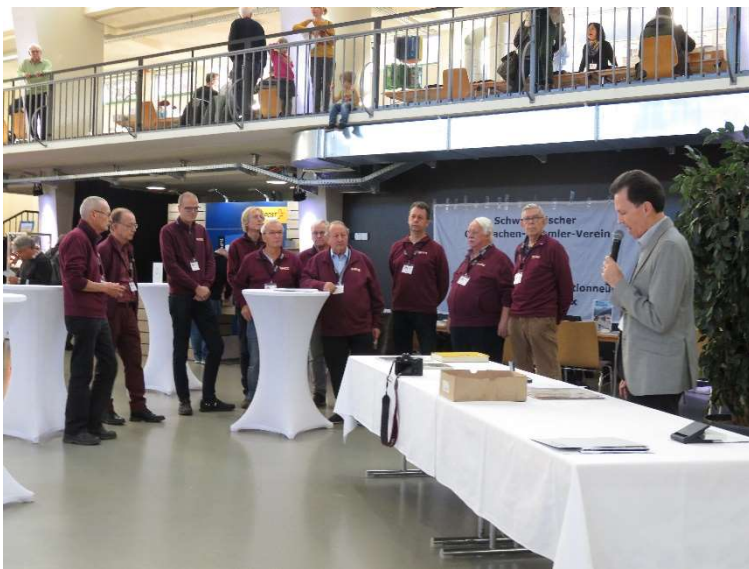
Ehrung der Schweizer Organisatoren der Bupra 2022