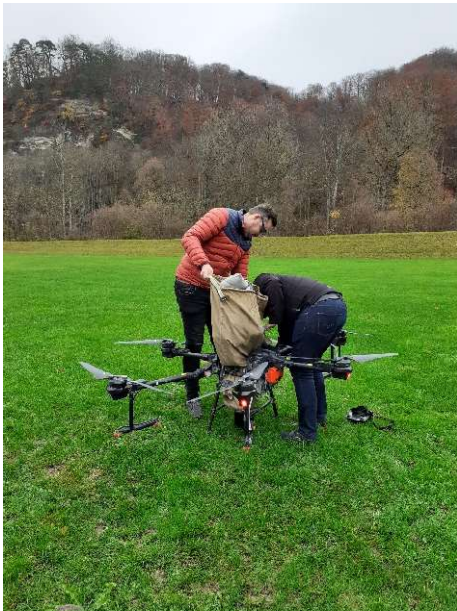
Verladen des Postsacks für den Postdrohnenflug von der Markthalle in das Postamt Burgdorf/CH.